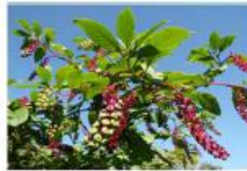
Raisin d'Amérique Phytolacca americana