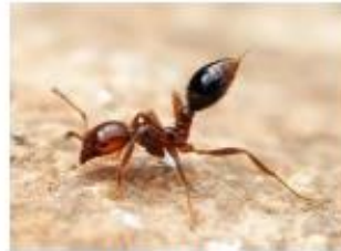
Fourmi de feu Solenopsis invicta