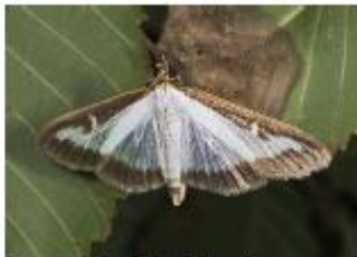
Pyrale du buis Cydalima perspectalis