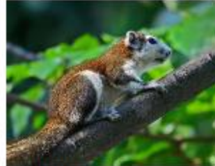
Ecureuil de Finlayson Callosciurus finlaysonii