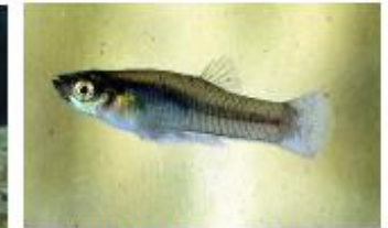
Guppy sauvage Gambusia affinis