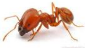
Fourmi de feu Solenopsis geminata