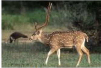
Cerf axis Axis axis