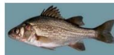
Baret Morone americana