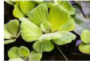
Laitue d'eau Pistia stratiotes