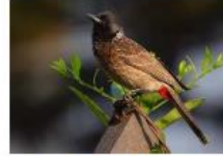
Bulbul à ventre rouge Pycnonotus cafer