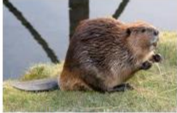
Castor canadien Castor canadensis