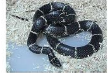
Serpent roi de Californie Lampropeltis getula