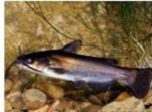
Poisson-chat commun Ameiurus melas