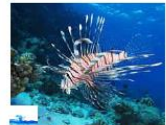
Poisson lion Pterois miles