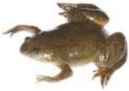
Xenope lisse Xenopus laevis