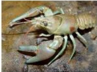
Ecrevisse à taches rouges Paxonius rusticus