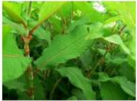
Remouée de l'Himalaya Koenigia polystachya