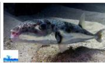
Poisson-ballon Lagocephalus sceleratus