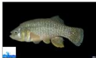
Choquemort Fundulus heteroclitus