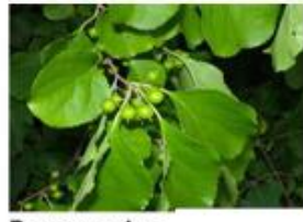
Bourreau des arbres Celastrus orbiculatus