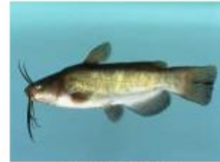
Barbotte brune Ameiurus nebulosus